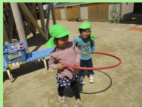
ほし組 (ひまわりグループ)

折り紙でイチゴを作りました。「このイチゴどうする？」と聞くと「飾る」「吊るしてイチゴ狩りみたいにしたい！」と自らの経験をあそびにできるほしぐみのこどもたちです。