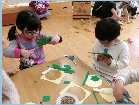
そら組 (たんぽぽグループ)

たんぽぽの綿毛を発見！「ふー」と吹く様子を見て、「ここが次はたんぽぽ広場になるんよ」とこどもたち。綿毛が種だと知っているんだね。