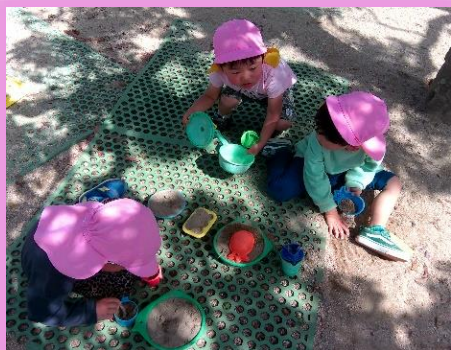
つき組 (なぐらグループ)

フラフープを持つと自然と電車ごっこが始まり、園庭を自由に回って楽しんでいます。「行ってらっしゃい」と手を振ると振り返してくれます。後ろの友だちと同じスピードで歩く心遣いが素敵です。