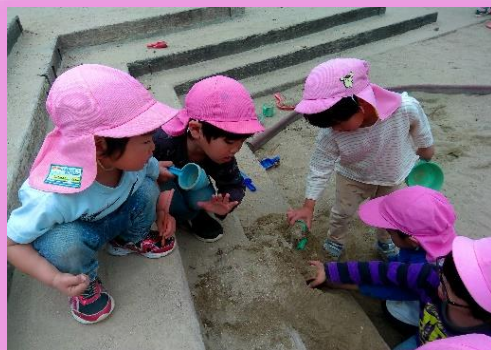
つき組 (つばきグループ)

数人で集まって木陰でワイワイ。見ると砂で作った料理を持ち寄って座っていました。「これは～」と作ったメニューを披露していて、少し遅めのお花見会でした。