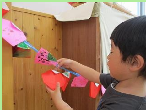
ほし組 (チューリップグループ)

そら組初めての製作はグループ名でもあるたんぽぽ作りです。見本を見ながら丸の形や葉っぱの形にハサミで切ります。線に沿ってゆっくりゆっくり、真剣です。