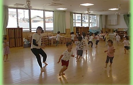
ほし組 (ひまわりグループ)

あすもっくるの際間をふさぐ工事に大工さんが来ました。「どこが壊れてるの?」「この道具は何?」とみんな大工さんがしていることや道具に興味津々です。こどもたちは釘付けでした。