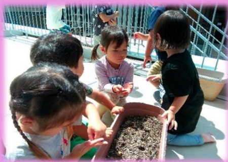
つき組 (なぐらグループ)

氷鬼が大好きなこどもたち。鬼にタッチをされて氷になった友だちを助けようと走ってくる姿がとってもかっこいいです。鬼に捕まらないようにどうやって友だちを助けるかこども同士で作戦を練る姿も出てきましたよ。