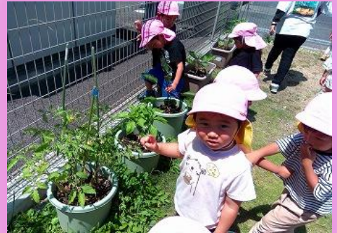
つき組 (つばきグループ)

はつか大根の種をまきました。「私もやりたい!」と種に興味津々なこどもたち。今は少し芽が出ています。「なんかでてるよ!」と成長を喜んでいます。