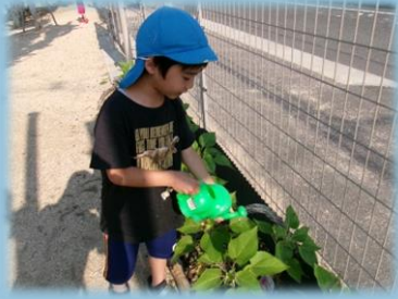
そら組 (れんげグループ)