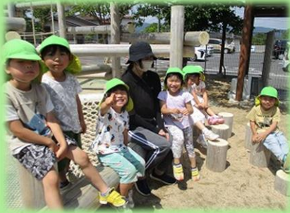
ほし組 (チューリップグループ)

そら組になり給食室の手伝いを任せられることが多くなっています。玉ねぎの皮むきでは、「目がいたい!」「涙がでてる」などと玉ねぎの皮剥きならではの感想が聞こえてきました。ぜひお家でも、お手伝いチャレンジしてみてください!