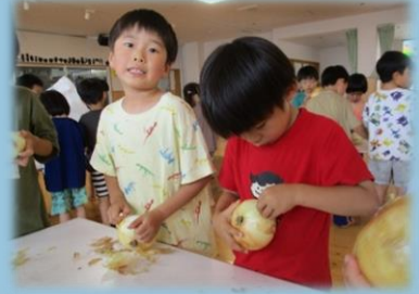
そら組 (たんぽぽグループ)

種から植えたひまわりが、葉が生い茂るほど大きくなりました。暑い日には「ひまわりののどが乾くから水をあげんと」とひまわりのお世話はかかせません。「葉っぱが大きくなるとる!!」と日に日に育つひまわりの変化を楽しんでいます。